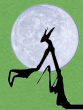
M.Perennou & C.Nuridsany, 1h15, 1996, France