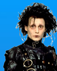
Tim BURTON États-Unis ; 1990 105 minutes