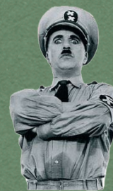
Charlie Chaplin, Etats-Unis - 1940 125 min - VF Comédie dramatique