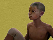
Simon Rouby France ; 2015, 1h25 min ; couleurs Animation, Guerre