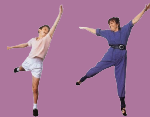
Stephen Daldry, Royaume-Uni, 2000, 110 minutes, fiction, couleur, 35 mm.