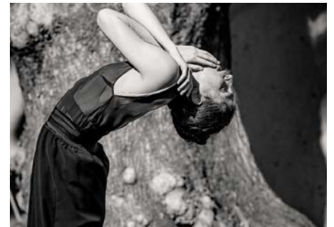
In the palm of your hand ©Sebastien Fraysse.