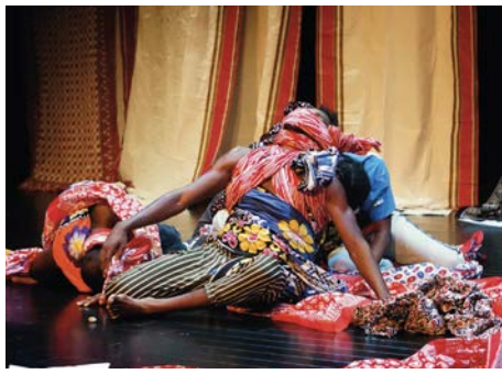
Murmures des décasés.