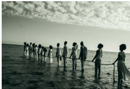
Déplacés ©Georges Michel.