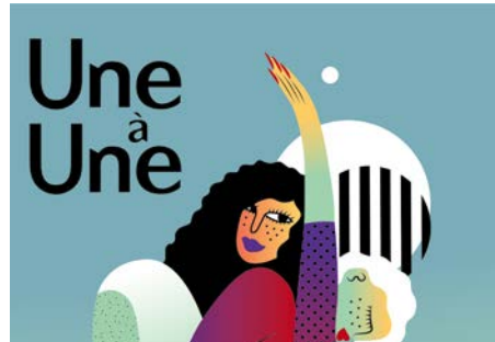
Une à Une ©Flo.

Contact médiation / scolaires : info@lalanbik.re Gwendoline hoarau 0692 75 16 79 Professeur relais : Severine.Bonjean@ac-reunion.fr 0692 11 88 33