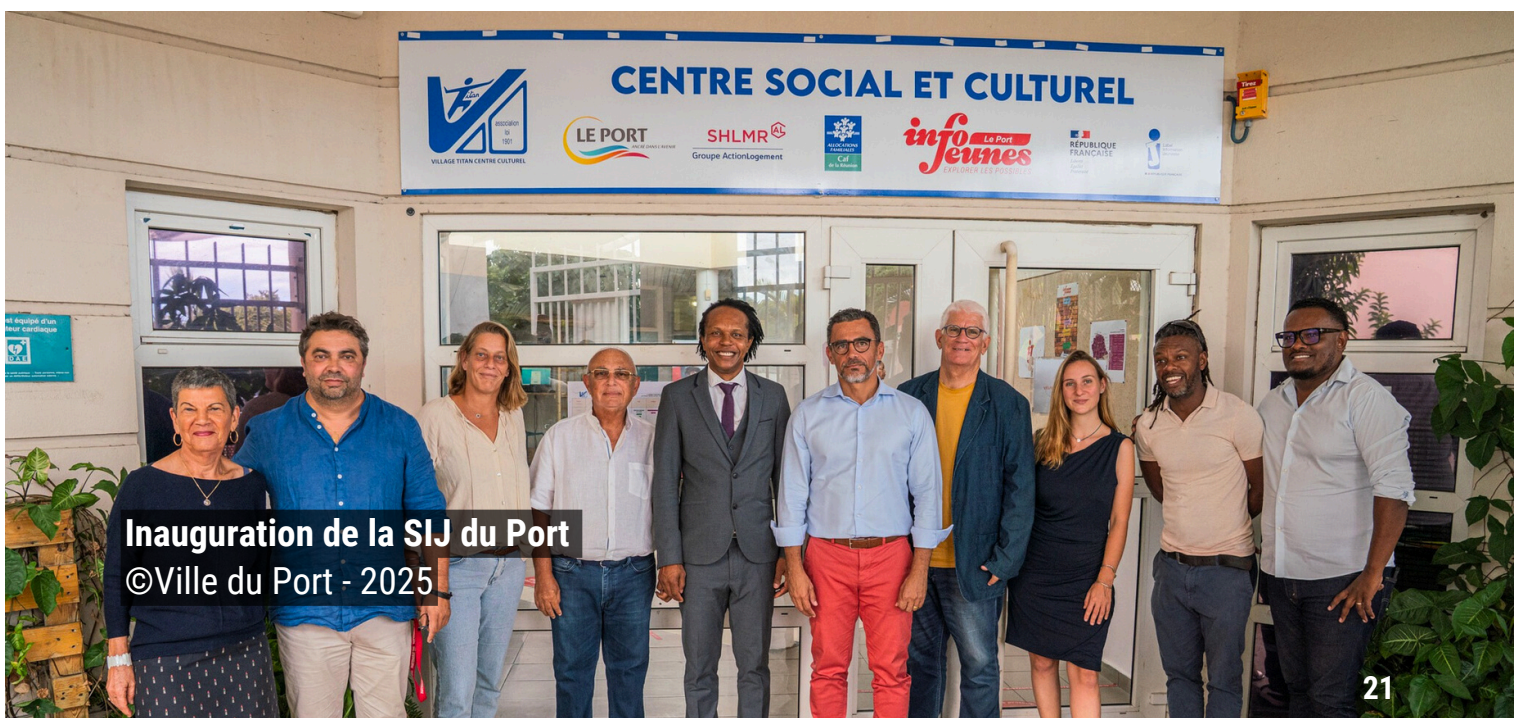
Inauguration de la SIJ du Port