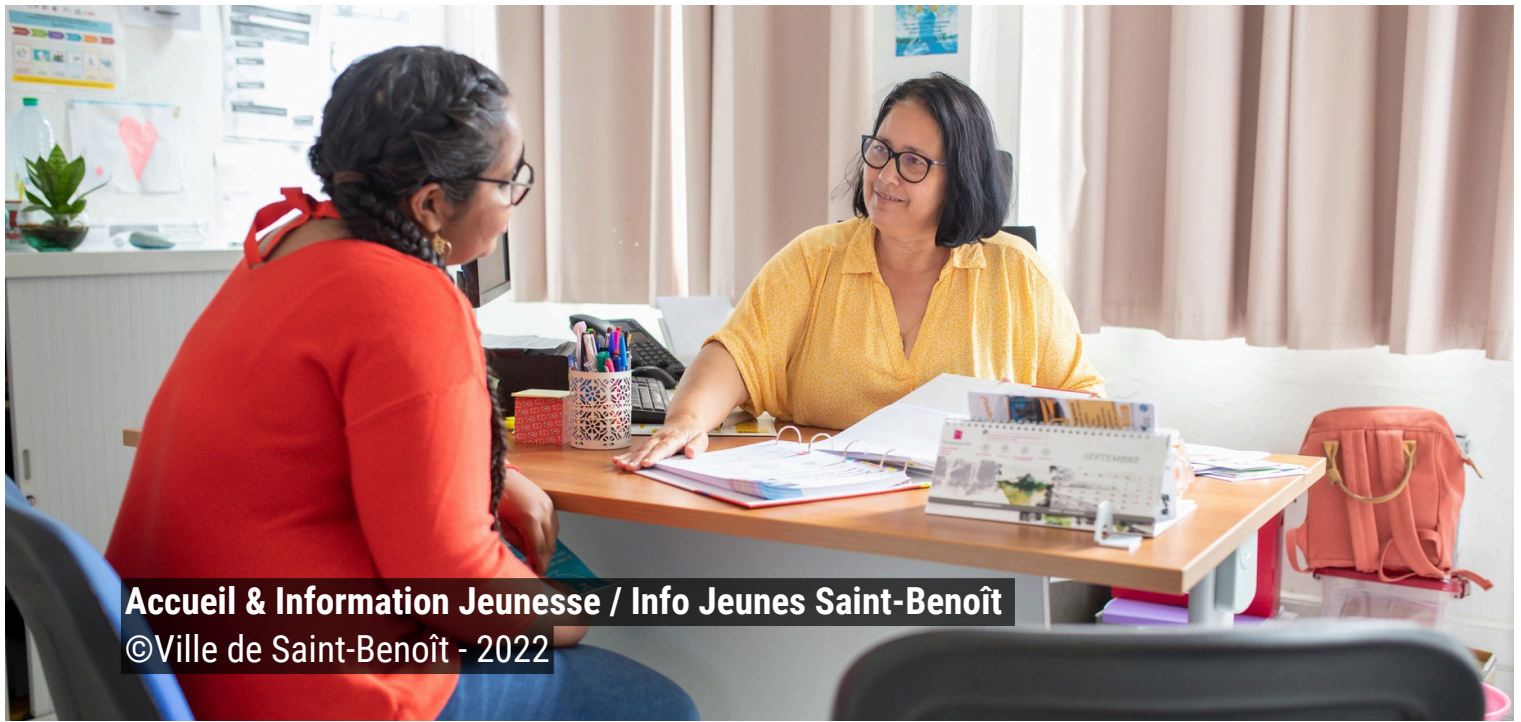
Accueil & Information Jeunesse / Info Jeunes Saint-Benoît