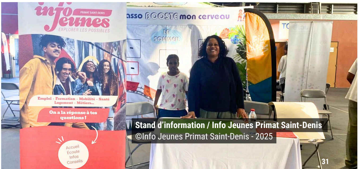
Stand d'information / Info Jeunes Primat Saint-Denis