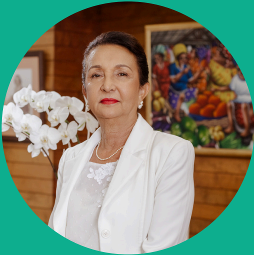
Huguette BELLO, Présidente de la Région Réunion

La jeunesse réunionnaise est une richesse inestimable pour notre territoire. Elle est dynamique, talentueuse, ambitieuse. Elle porte en elle l'énergie, la créativité et la volonté de bâtir un monde plus juste et plus solidaire. Mais pour que ses potentiels s'expriment pleinement, elle a besoin d'être mieux comprise, mieux entendue, mieux accompagnée.