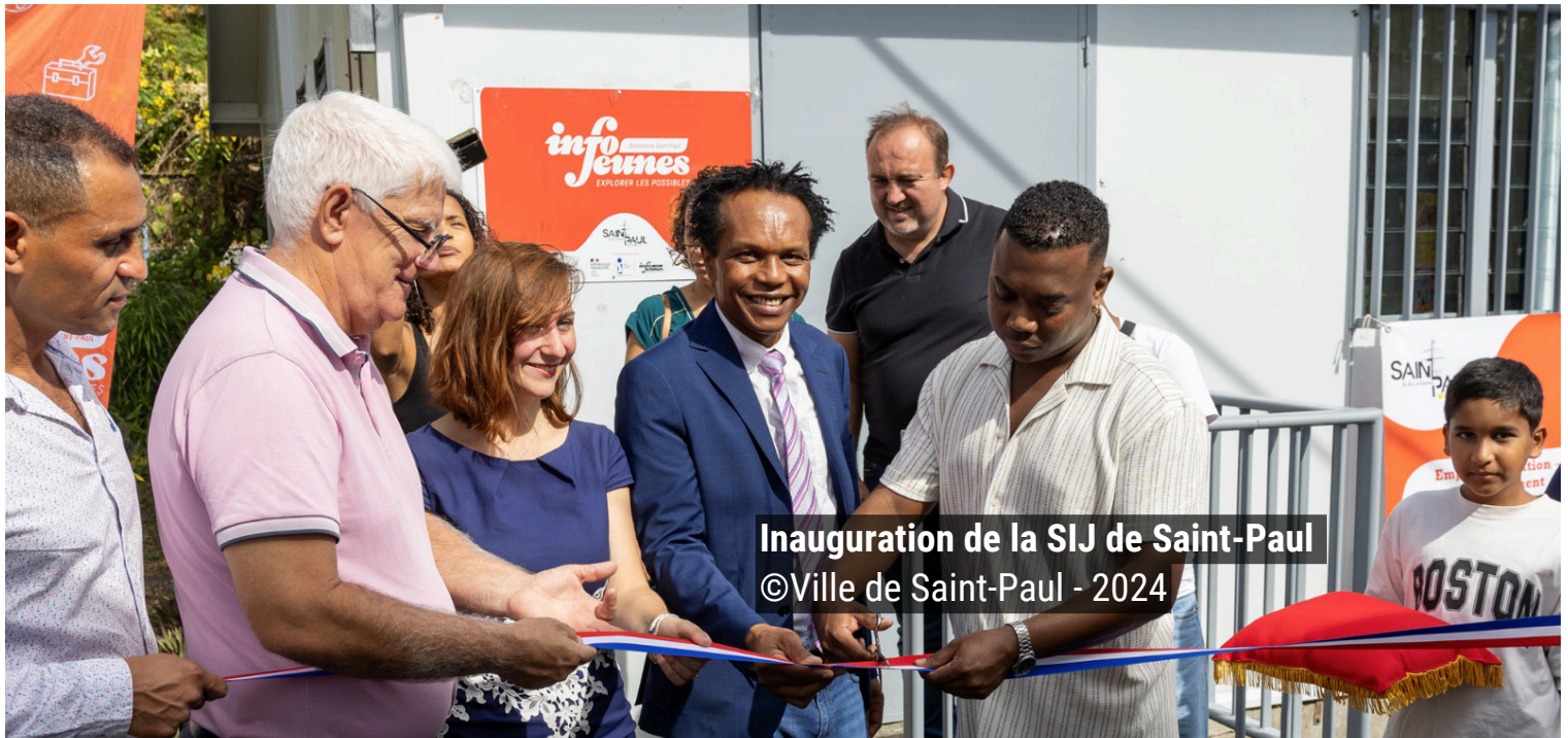
Inauguration de la SIJ de Saint-Paul