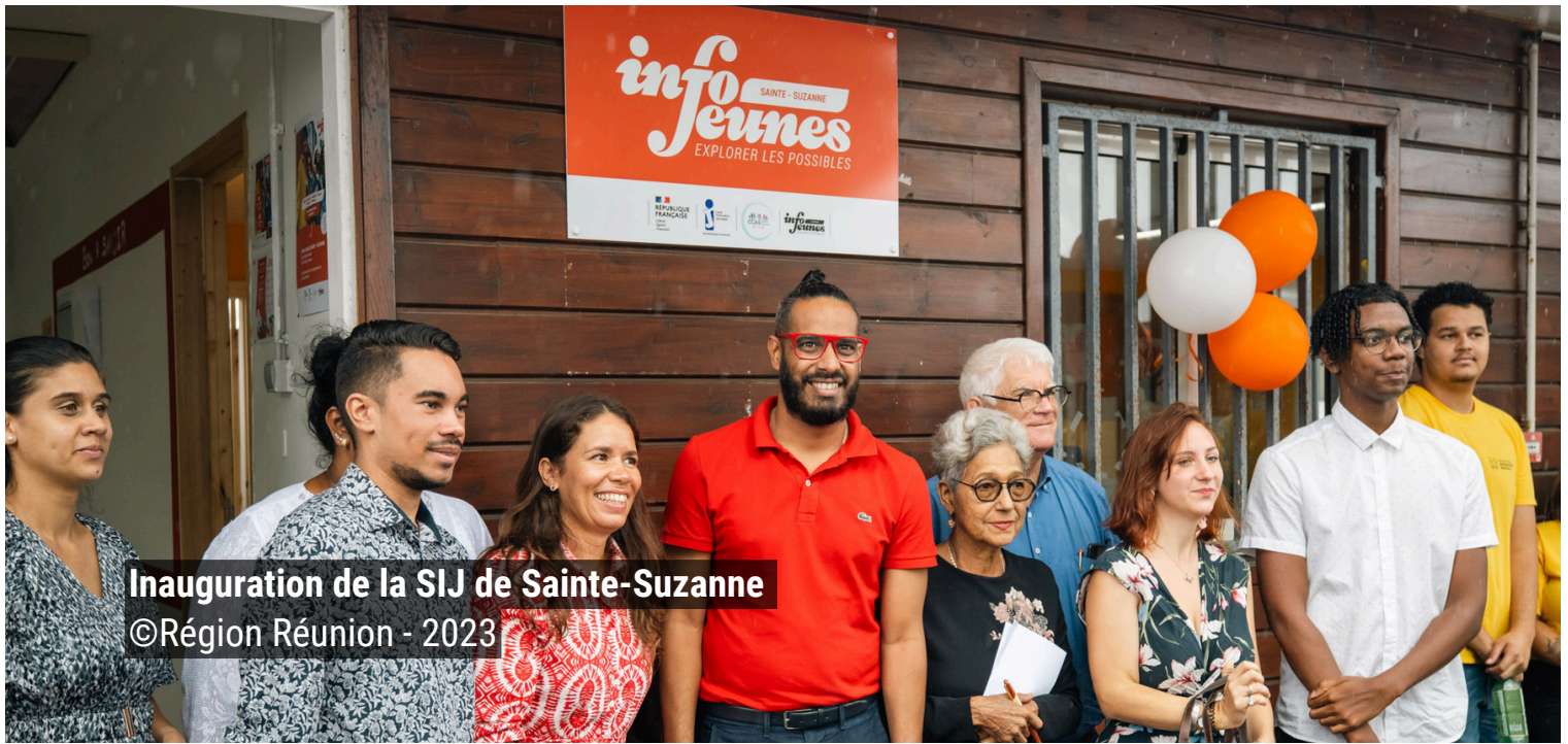
Inauguration de la SIJ de Sainte-Suzanne