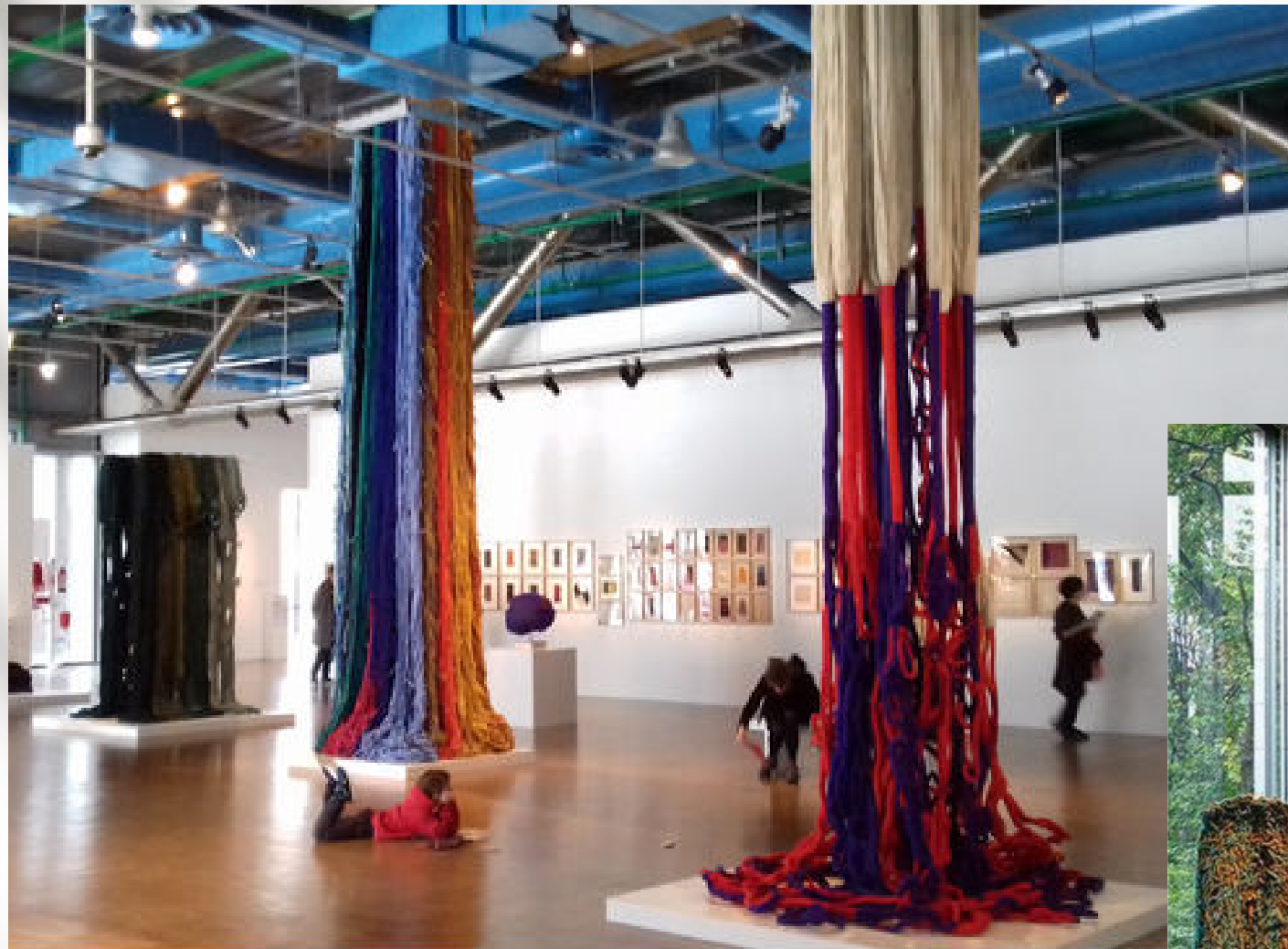
Exposition Centre Pompidou Sheila Hicks 2018