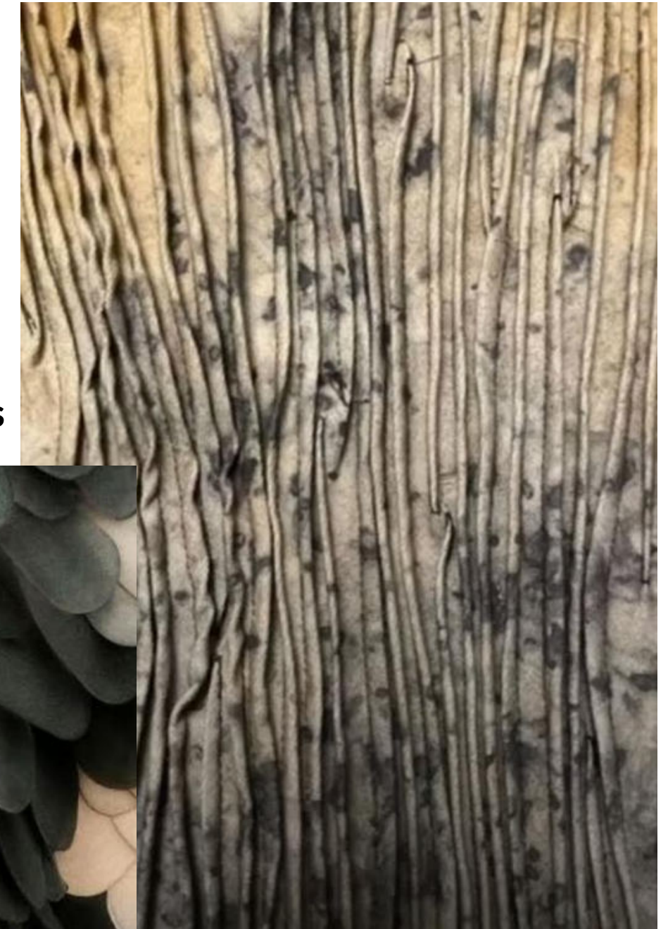
Imitation d'une écorce d'arbre