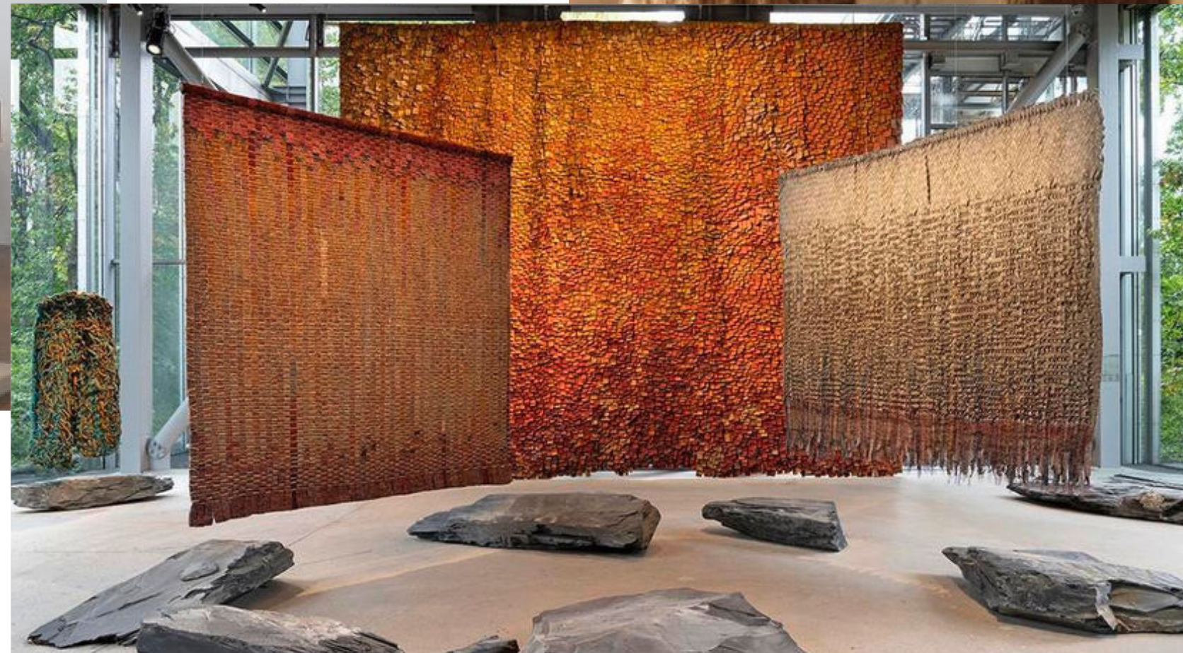
Exposition Fondation Cartier de l'artiste colombienne Olga de Amaral