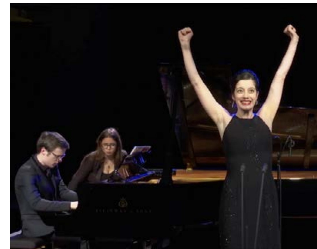
Victoires de la Musique Classique 2017 ©

En concert, elle collabore avec des artistes prestigieux tels que Renaud Capuçon, Henri Demarquette, Ophélie Gaillard, Hervé Pierre ou Brigitte Fossey.