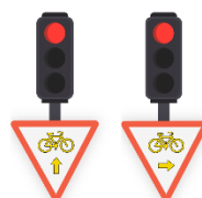
TOUT DROIT OU TOURNE-À-DROITE : AUTORISATION DE DÉPASSER LE FEU ROUGE, EN CÉDANT LE PASSAGE AUX PIÉTONS ET AUX VÉHICULES QUI BÉNÉFICIENT DU FEU VERT