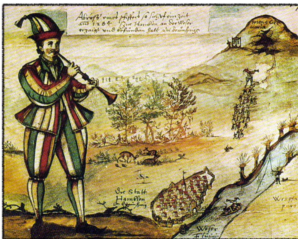
La plus ancienne représentation du joueur de flûte (1592), aquarelle d'Augustin von Moersperg

Spectacle musical pour chœur d'enfants d'après la légende du Joueur de flûte de Hamelin Spectacle à partir de 8 ans - durée : 1h30