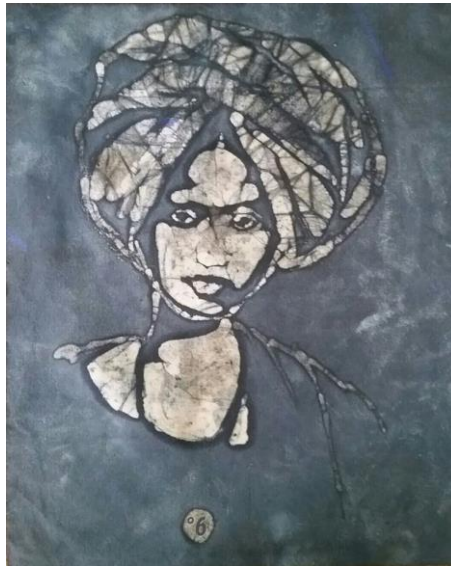
Batik représentant Magdalena, réalisé par Fancky Lauret.

La troisième fois ? C'est l'exécution publique ! Pour l'exemple.